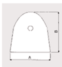
Schéma 2 Anode circulaire